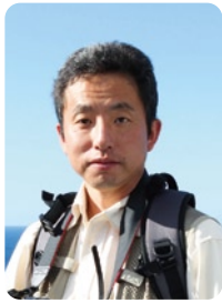
写真家 大塚 雅貴 おおつか まさたか